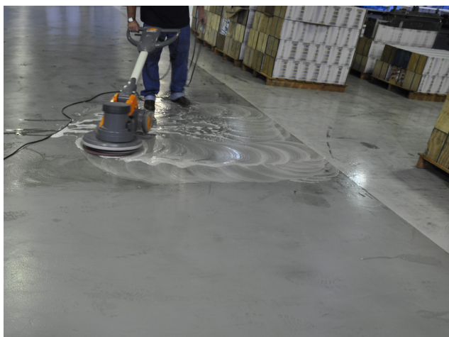
FREGADO CON DILUCIÓN DE AGUA Y D300®